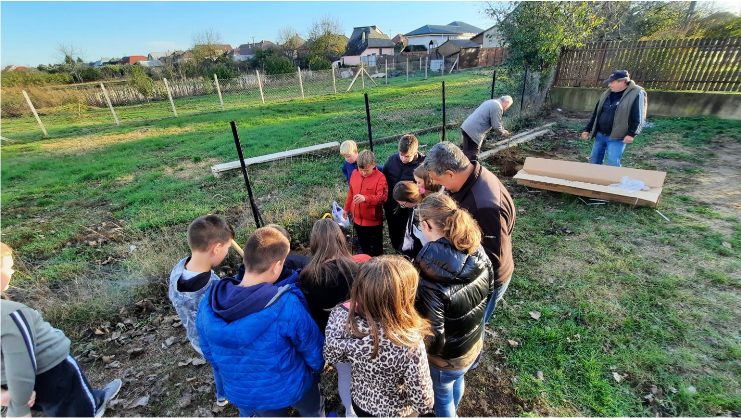
Ajaki Tamási Áron Katolikus Általános Iskola